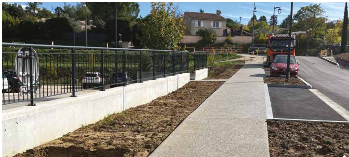
Valorisation de l'allée Camille Claudel.

L'allée Claudel dessert le cimetière et l'espace cinénaire de la commune et a connu ces dernières années une urbanisation continue jusqu'aux limites nord de l'agglomération.