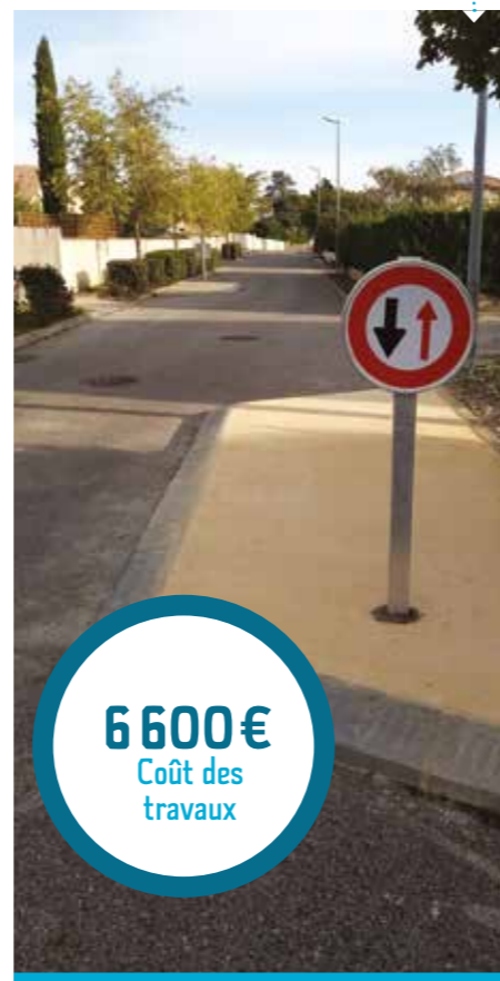
Les îlots du chemin.

Ainsi, des îlots et des panneaux ont été installés afin de permettre d'améliorer la sécurité sur le secteur en limitant la vitesse des véhicules sur cette voie.