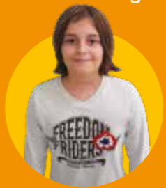
Liam École de la Gare