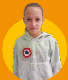
Violette École Sainte-marthe