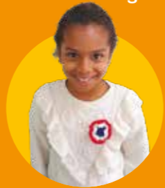
Kara École de la Gare