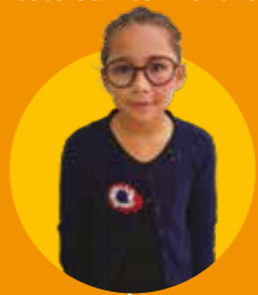
Ambre École du Village