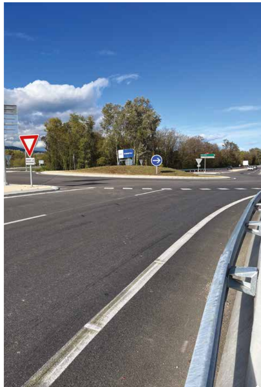
Le rond-point des Josserands qui facilite la circulation.

Le carrefour des Josserands était identifié depuis longtemps comme dangereux pour les nombreux usagers qui l'empruntaient. Ainsi, le département de la Drôme a lancé début janvier la création d'un rond-point et des travaux d'élargissement de la chaussée de la RD111 entre le pont de Charme et la nationale 7.