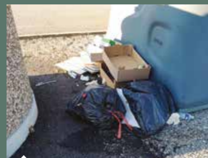
Dépôts sauvages de déchets.