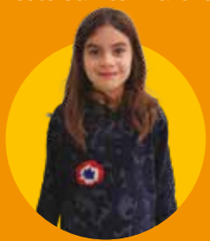
Anais École du Village