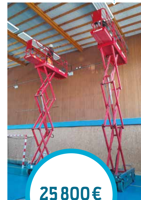
Remplacement de l'éclairage du gymnase.

Ces travaux ont été effectués cet été afin de réduire l'impact pour les usagers de ces bâtiments. Ils ont notamment été rendus possible grâce au subventionnement du Syndicat Départemental d'Électricité de la Drôme (SDED) à hauteur de 4 130 €.