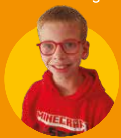
Timéo École du Village