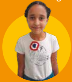
Tasnim École du Village