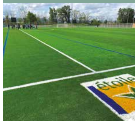
La nouvelle pelouse du stade de la Véore.

Lors de cette journée, les Étoiliens ont également pu apprécier les exploits des footballeurs du club contre une sélection « all-stars ». Un événement placé sous le signe de la convivialité et du partage.