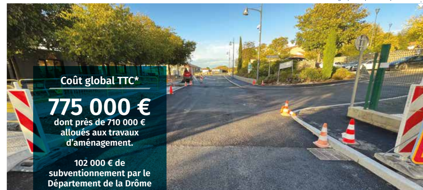
La route de Beauvallon a été réaménagée pour plus de facilité.

de la commune. Enfin, dans le cadre des aménagements routiers, route de Beauvallon et allée Camille Claudel, il sera aussi procédé en partenariat avec les concessionnaires et exploitants de réseaux à la rénovation et à la mise en conformité des réseaux divers humides et secs avec notamment l'extension de l'éclairage public et de la vidéo-protection.